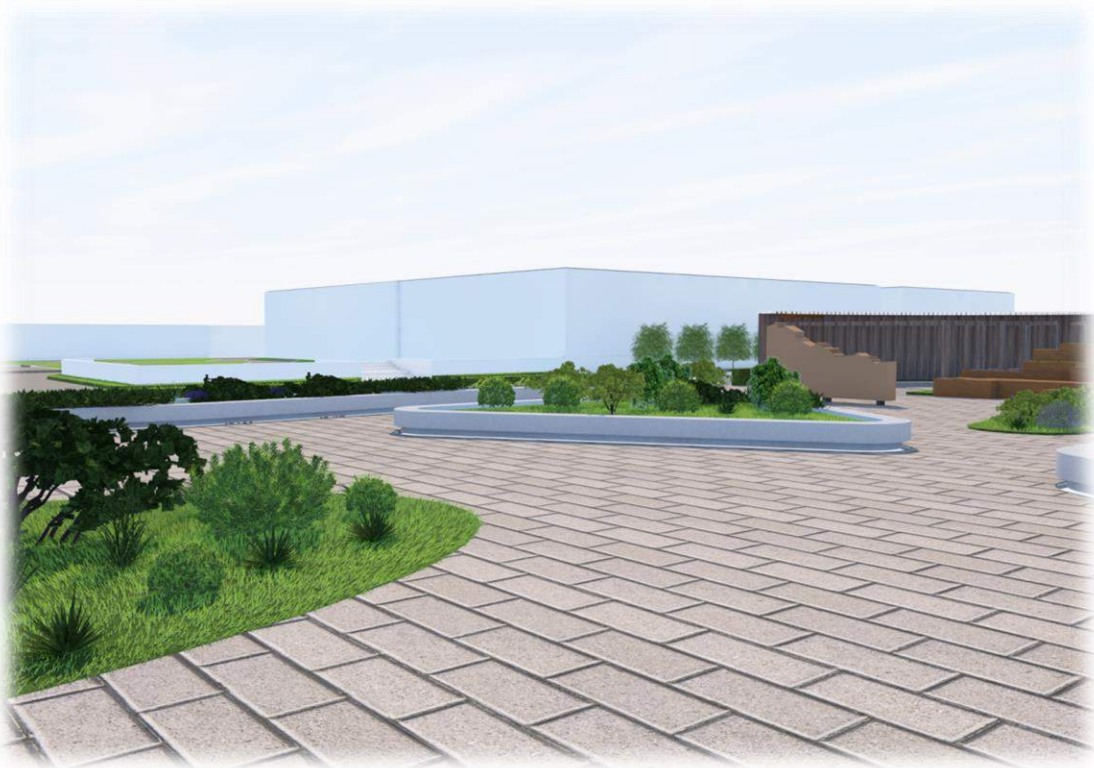
Вид на озелененную зону отдыха