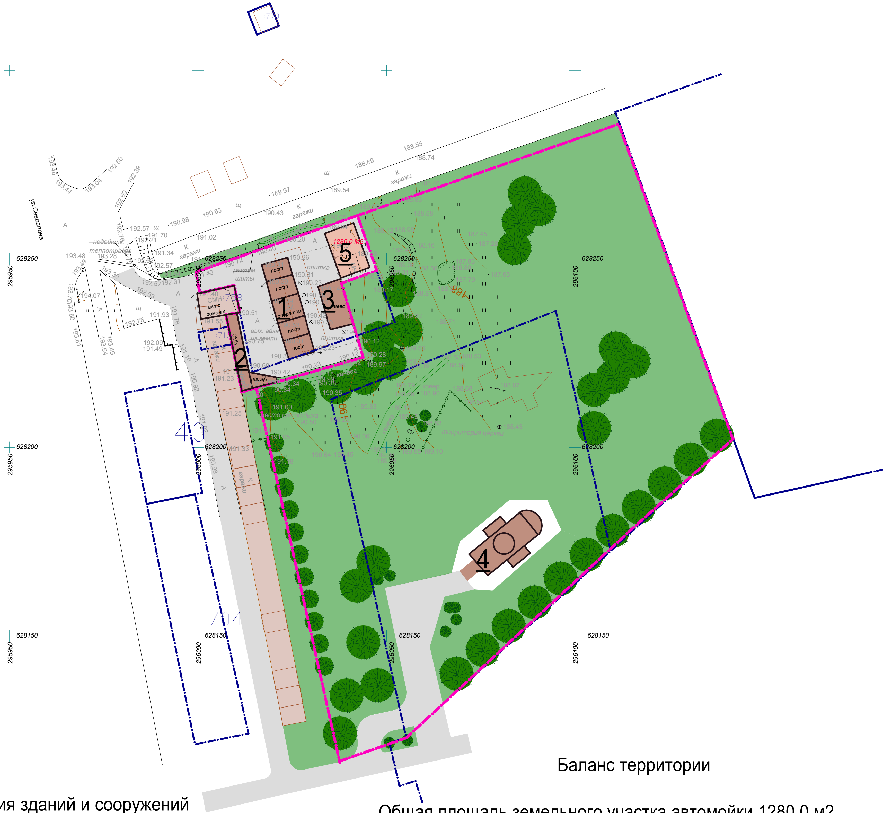
Экспликация зданий и сооружений